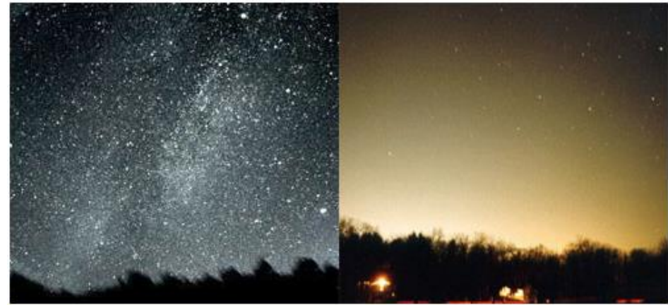
Ciel en 1950...