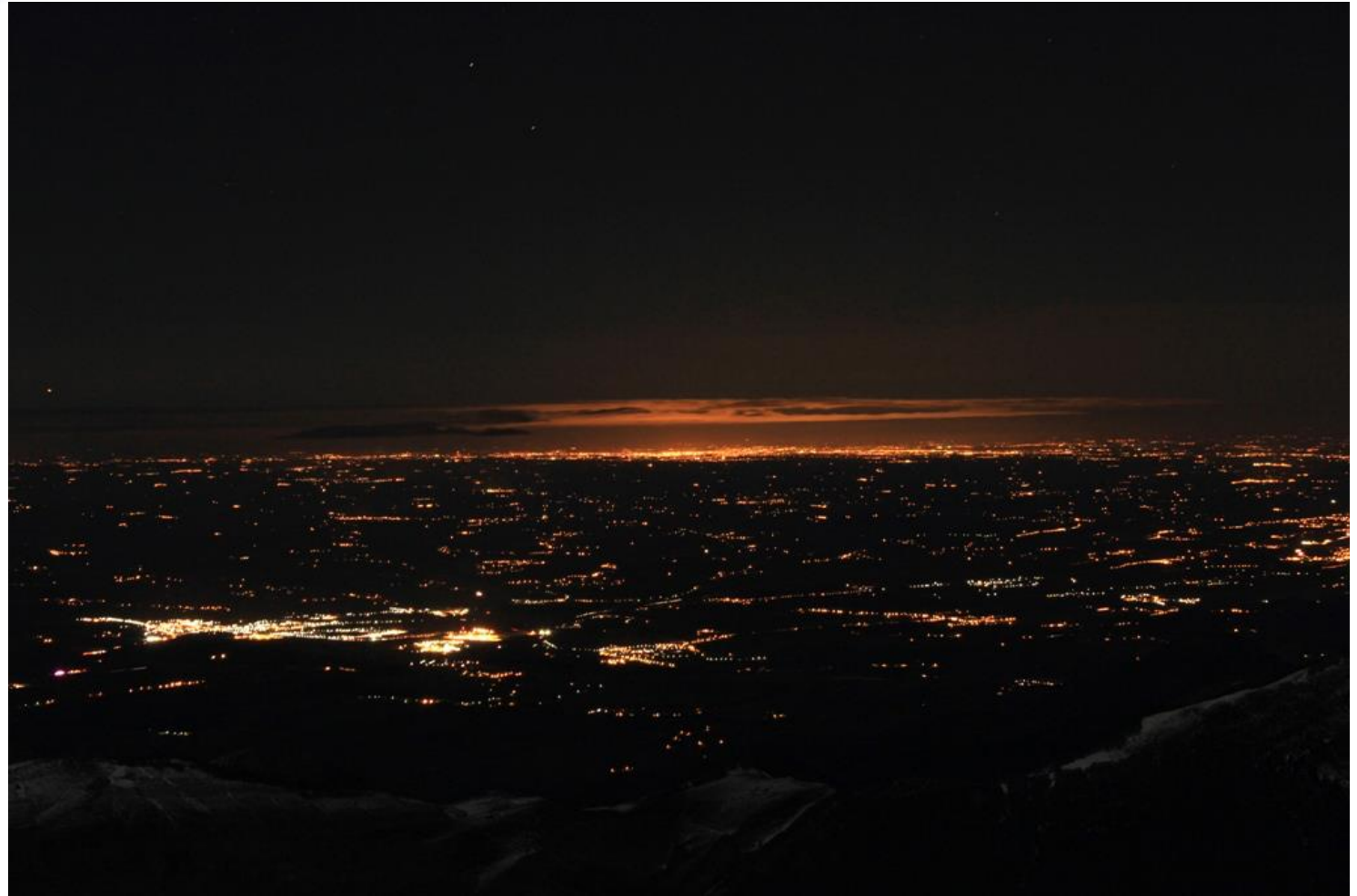
Lannemezan (au premier plan) et Toulouse (au fond) vues du Pic du Midi.